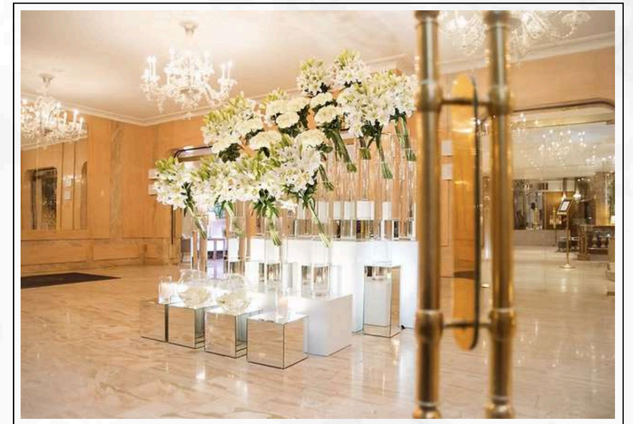
LES SALONS HOCHÉ - PARIS 8

PLUS DE 200 PERSONNES ATTENDUES (DIRECTION GÉNÉRALE, FONCTIONS RSE, RH, COMMERCE, MARKETING COMMUNICATION...)